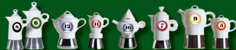
Espressine classic e a-portèr