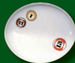
piatto unico ovale cm.29 x 25