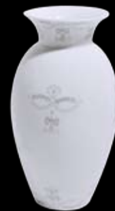
Cod.32767 VASO BAHIA MEDIO (25h) 99/434