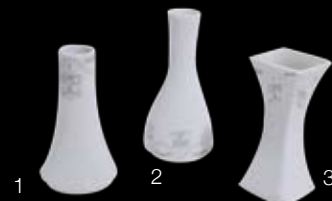
1. Cod.32776 VASETTO RIVIERA (14h) 99/429 2. Cod.32777 VASETTO SOLIFLEUR (12,3h) 16/096 3. Cod.32778 VASETTO/CANDELA DUBLEFACE (12,4 h) 99/619