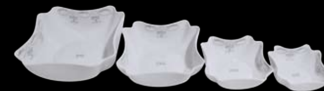
Cod.32771 COPPA QUADRA GRANDE (24X8h) 99/280 Cod.32772 COPPA QUADRA MEDIA (19,7X6,6h) 99/281 Cod.32773 COPPA QUADRA MEDIA/PICCOLA (15X5h) 99/282 Cod.32774 COPPA QUADRA PICCOLA (13X4,5h) 99/283

Assortimento Ravel e Chopin entrambi disponibili sulle forme proposte.