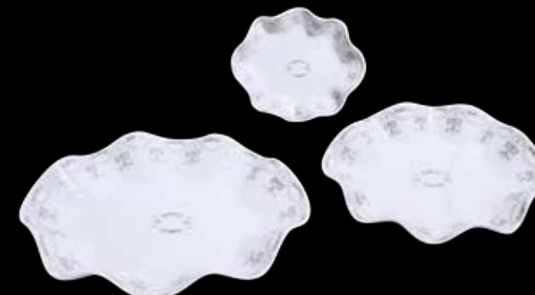
Cod. 32763 CENTRO FLAMENCO GRANDE (32x27x5h) 99/257 Cod. 32764 CENTRO FLAMENCO MEDIO (25x21x4h) 99/256 Cod. 32765 CENTRO FLAMENCO PICCOLO (16x14x3h) 99/255