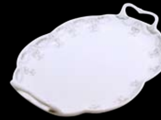
Cod.32854 VASSOIO OVALE MADRID (23,5X32,5X5,5h) 99/048