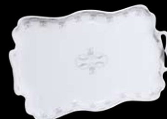
Cod.32780 VASSOIO RETTANGOLARE CAPPATO C/MANICI (42x26x5h) 99/080