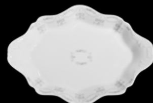
Cod.32768 VASCHETTA OVALE CAPPATA (26,5X19X4h) 99/488