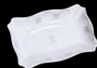
Cod.32766 VASCHETTA RETTANGOLARE (14,4X9,2x3,2h) 99/492