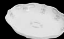
Cod.32779 CORBA OVALE GRANDE (16X19X3,6h) 99/058