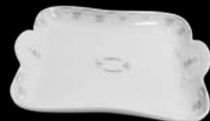
Cod. 32781 VASSOIO QUADRO COIMBRA C/MANICI (26X23) 99/493