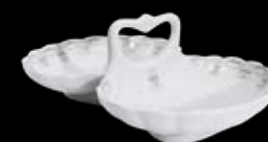
Cod.32855 CONCHIGLIA DOPPIA GRANDE (17,5X25X9h) 99/052