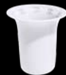
Cod.32775 VASETTO ZARA (10h) 99/170