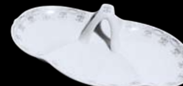
Cod. 32769 ANTIPASTIERA 3 POSTI (15X27,5X7h) 99/079